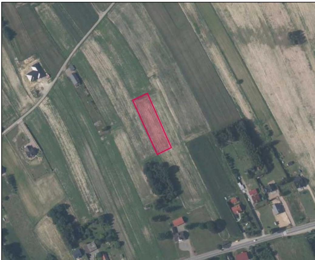
Rys. 3. Ortofotomapa z widokiem na przedmiotową nieruchomość, uzbrojenie oraz najbliższe otoczenie