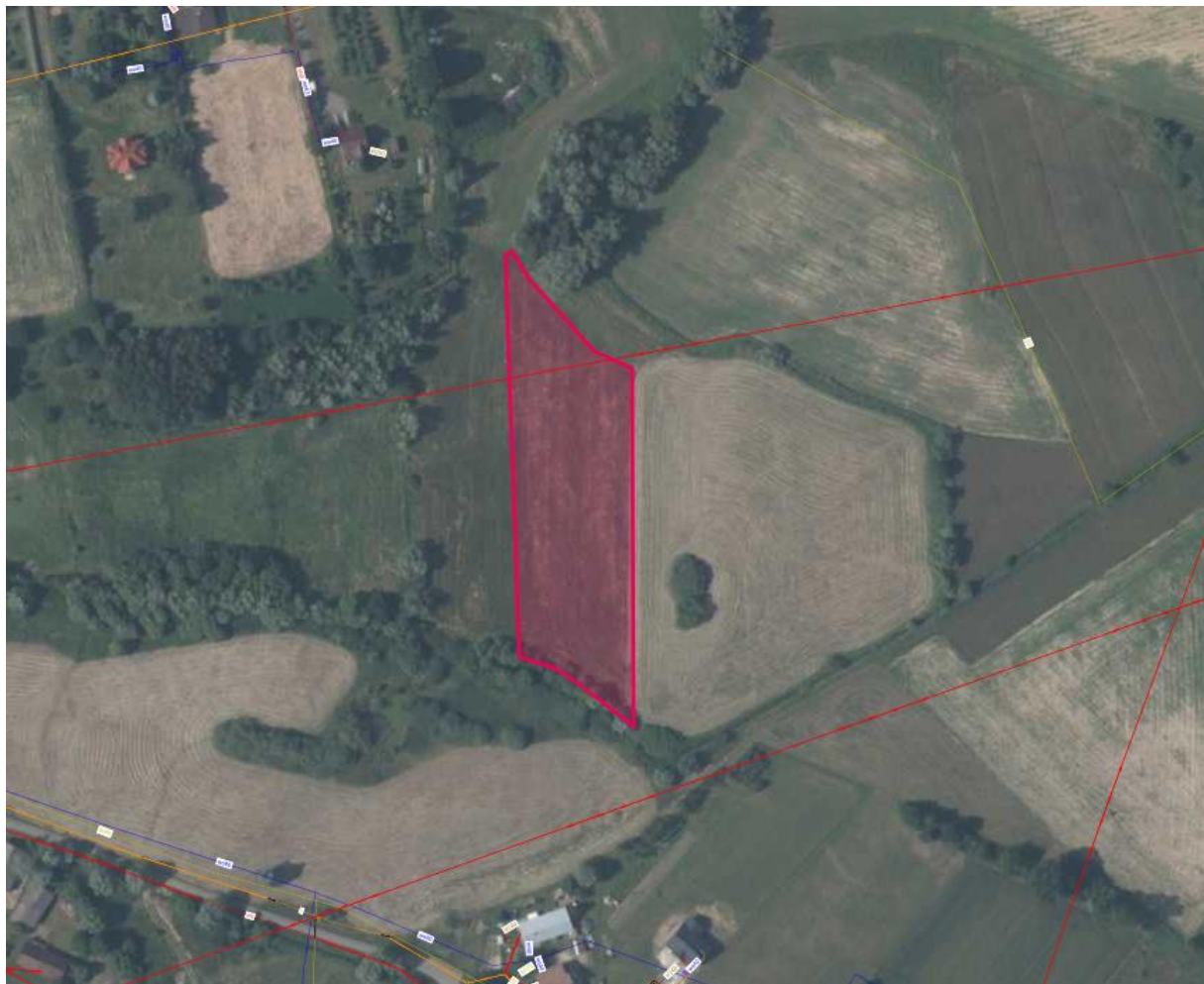
Rys. 3. Ortofotomapa z widokiem na przedmiotową nieruchomość, uzbrojenie oraz najbliższe otoczenie